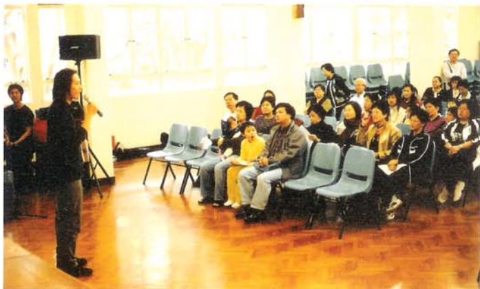
世界龍岡學校黃耀南小學，嘉賓聆聽主持介紹計劃。