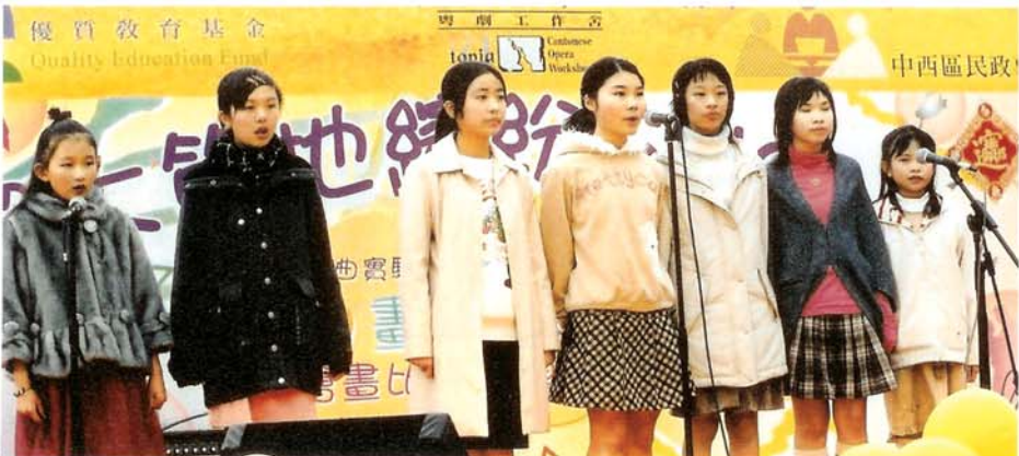
於大笪地舉行的「粵曲畫意《親子情》」活動。